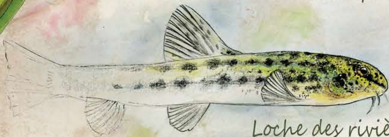
Loche des rivières